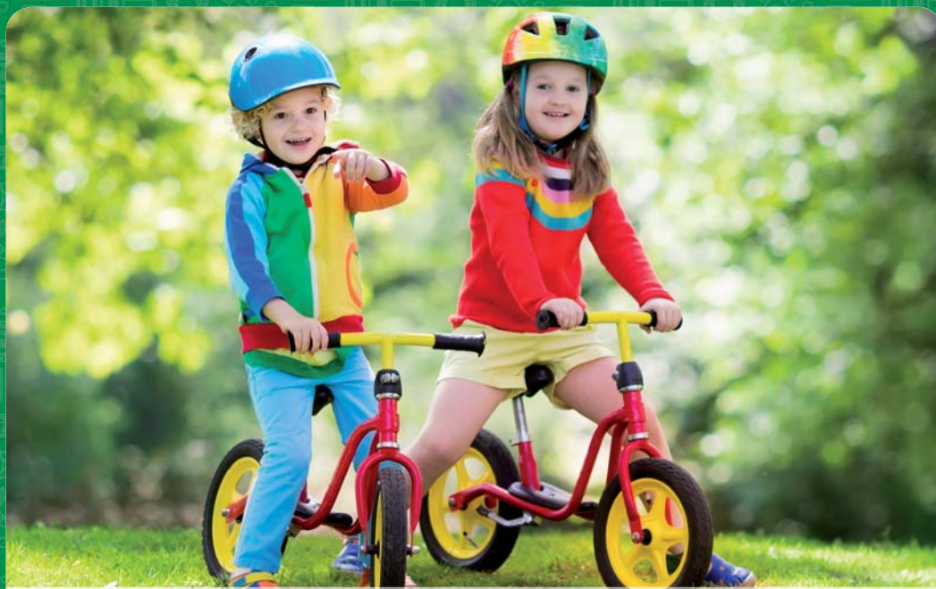
AMERIČTÍ RODILÍ MLUVČÍ S PEDAGOGICKÝM VZDĚLÁNÍM V KAŽDÉ TŘÍDĚ